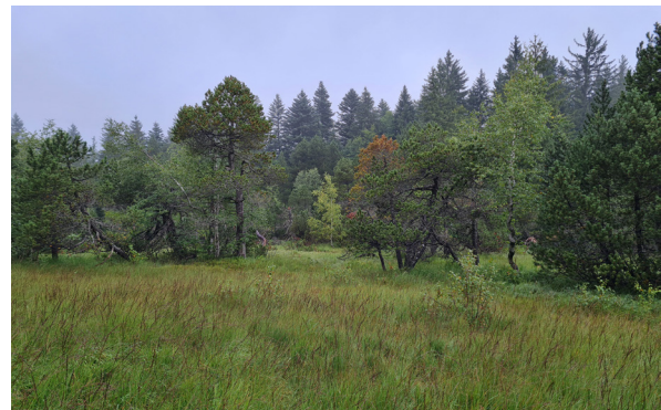
Blick vom Wanderweg ins Boggenmoor hinein.

Botanisch gesehen ist die Fläche eher artenarm wie die meisten Böden in Fichtenwäldern. Die heruntergefallenen Fichtennadeln versauern den Boden oberflächlich, was viele Pflanzen nicht mögen. Auch das fehlende Licht auf diesen Waldböden stellt für viele Pflanzenarten ein Problem dar.