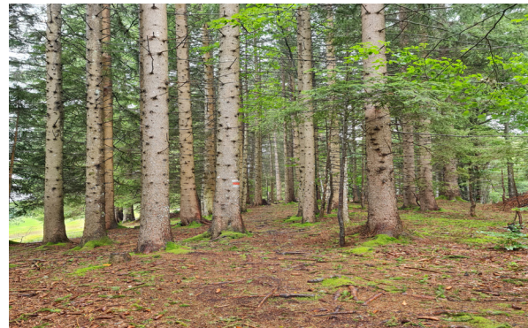
Der trockene Boden ist ideal für die Fichten. Die Nadeln auf dem Waldboden versauern diesen oberflächlich.

Der lichte Fichten- Laubmischwald hier befindet sich auf der gleichen bauchigen Krete, auf der weiter westlich auch das Boggenmoor liegt. Der Boden ist eher trocken, auf jeden Fall nicht vernässt. Das gefällt den Fichten. Sie mögen keinen sumpfigen Boden, deshalb kommen sie an vernässten Stellen nicht vor. Wenn doch, dann zeigen sie einen kümmerlichen Wuchs.