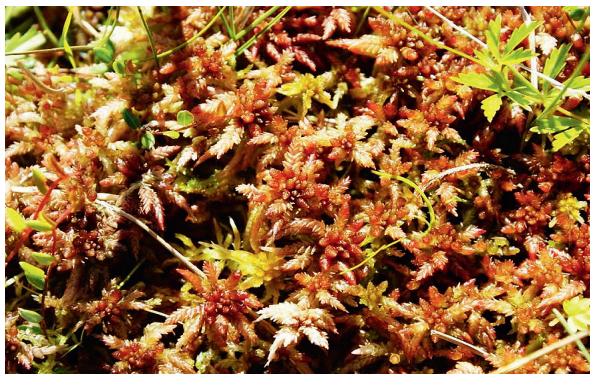
Torfmoose sind die Bausteine eines Hochmoors.

Ein Moor ist wegen den dort herrschenden extremen, sauren Lebensbedingungen meist artenarm. Es gibt aber spezialisierte Pflanzen und Tiere, die nur dort überleben können. Neben Torfmoosen findet man zum Beispiel im Hochmoor den Rundblättrigen Sonnentau und das Gemeine Fettblatt. Mit ihren klebrigen Blättern fangen diese beiden Pflanzen Insekten, die sie verdauen, um ihren Nährstoffbedarf zu decken. Auffällig und im Boggenmoor gut sichtbar sind im Sommer die moortypischen Wollgräser.