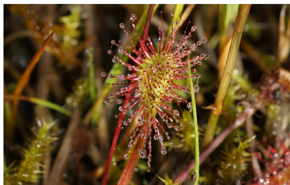
Der Sonnentau lockt Insekten auf seine klebrigen Blätter.

Torfmoose können bis das 25-fache ihres Gewichts an Wasser speichern. Auch auf dem Wanderweg kann man die Feuchte des Bodens unter seinen Füßen spüren oder mit den Händen fühlen. Und vielleicht siehst du gar ein paar der unscheinbaren mooraufbauenden Torfmoose.