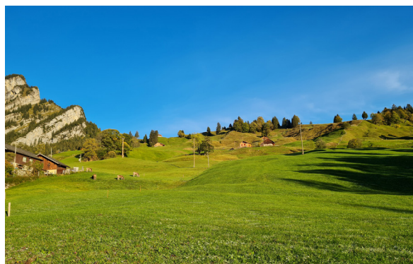
Die einzelnen Höfe und Ferienhäuser verteilen sich in der Landschaft.

Auf dem Rückweg zum Obersee fallen die landwirtschaftlich genutzten Wiesen am Wegrand auf. Diejenigen Flächen im Oberseetal, die nicht unter Schutz stehen, werden teils intensiv bewirtschaftet. Auch in diesen sind immer wieder feuchte Flächen vorhanden, die speziell und schonend bewirtschaftet werden. Im gesamten Gebiet findet man viele Stellen, an welchen Wasser aus dem Boden tritt.