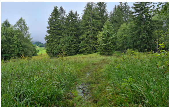
Auf torfigem Boden bleibt das Wasser länger stehen.

Hier ist der Boden sumpfig und erinnert schon etwas an ein Moor. Es wachsen nur Pflanzen, die gut mit diesen speziellen Bedingungen umgehen können. Die Hochstauden und hohen Gräser sind perfekt daran angepasst. Ihr dichtes Blätterwerk hält den Boden zudem auch bei stärkerer Sonneneinstrahlung zusätzlich feucht. Feuchtflächen helfen, das Klima in der Umgebung stabil zu halten. An Hitzetagen geben sie Feuchtigkeit ab und verringern so die Umgebungstemperatur.