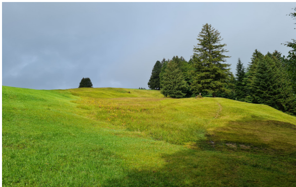
Die unterschiedlichen Farben der Wiese zeigen an, dass verschiedene Bodenbedingungen herrschen.

Steh still und lausche den Vögeln. Wie viele verschiedene Stimmen erkennst du? Woher kommen diese? Sind es Vogelgesänge oder eher Rufe? Nach wenigen Minuten gewöhnen sich die Vögel an deine Anwesenheit und verhalten sich wieder normal. Siehst du sie auch?