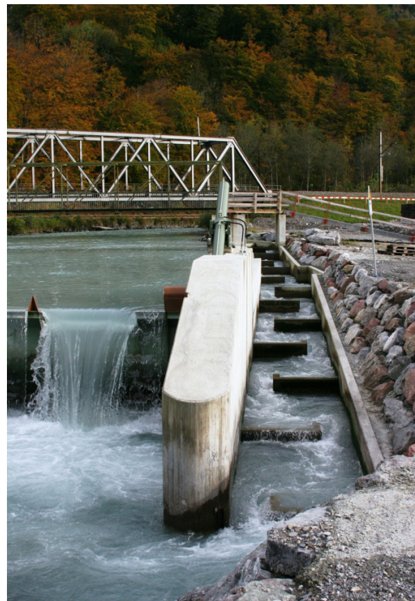
Fischtreppen im Mühlefuhr Ennenda

Seeforellen sind beliebte Speisefische. Da die ausgewachsenen Tiere erst im Herbst, also praktisch schon in der fischereilichen Schonzeit, in die Glarner Fließgewässer hinein ziehen, sind Glarner Fänge des bei uns grössten Lachsverwandten aber rar. 2018 wurden lediglich 280 Seeforellen gefischt.