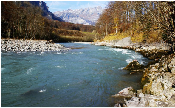
Linth bei Uschenriet Mitlödi