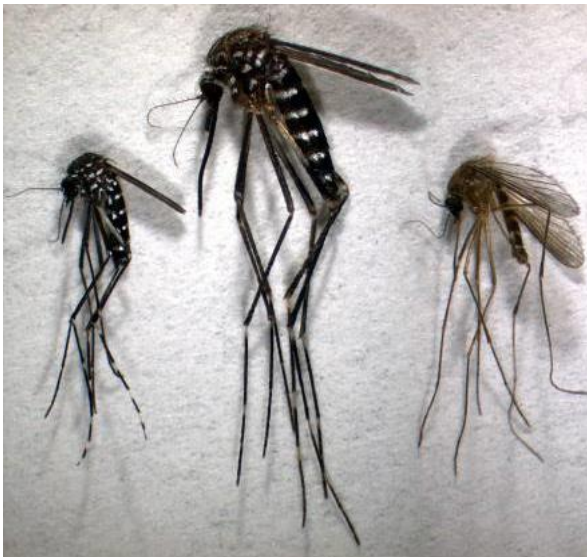
Von links nach rechts: Tigermücke ( Ae. albopictus ), Japanische Buschmücke ( Ae. japonicus ) und einheimische Gemeine Hausmücke ( C. pipiens ).

Die Buschmücke ist grösser als die einheimische Gemeine Hausmücke ( Culex pipiens ) und die Asiatische Tigermücke ( Aedes albopictus ). Sie ist schwarz-braun und hat, ähnlich wie die Tigermücke, auffällige weisse Ringe am Körper und an den Beinen. Die Buschmücke hat drei weisse Ringe, die Tigermücke fünf.