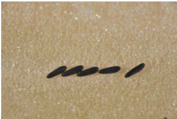
Eier der Buschmücke, ca. 0.5 mm.

Ein Mückenweibchen legt bis zu 100 Eier in der Nähe von kleinen Wasseransammlungen.