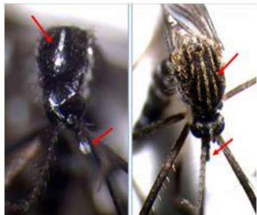
Die Buschmücke (rechts) hat drei gelbliche Längsstreifen auf dem Brustücken, die Tigermücke (links) hingegen nur einen weissen.