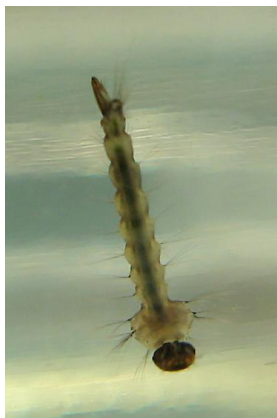
Larve von Aedes japonicus .

Brutmöglichkeiten können natürlich (Astlöcher, Baumhöhlen, Blattachseln, Felslöcher) oder künstlich (Regentonnen, Wassertanks, Kinderbadebecken, Vasen, Getränkedosen, Vogelbäder, Autoreifen) sein. Die Eier können den Winter und auch vorübergehende Trockenheit überleben.