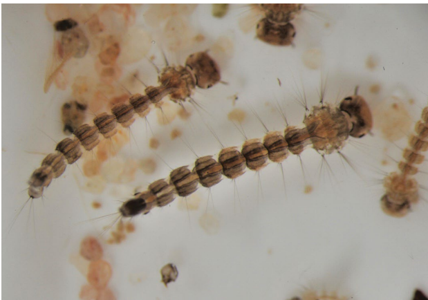
Die im Wasser lebende Larven der Asiatischen Tigermücke sind im ersten Larvenstadium 1 bis 2 mm, im vierten Larvenstadium ca. 9 mm lang.