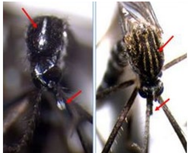
Die Asiatische Tigermücke (links) hat einen weissen Längsstreifen auf dem Brustücken, die Japanische Buschmücke (rechts) hingegen drei gelbliche.